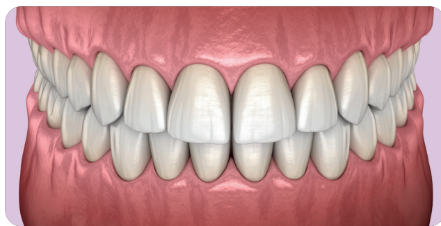
Dents soignées suite au détartrage.